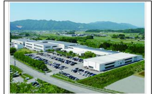
株式会社新潟ジャムコの全景

①ギャレー内部の接着を熟練者が人手で行なっており、それを自動化したい。 ②ラバトリー等の壁の中間組立作業をしてくれる企業を望む。