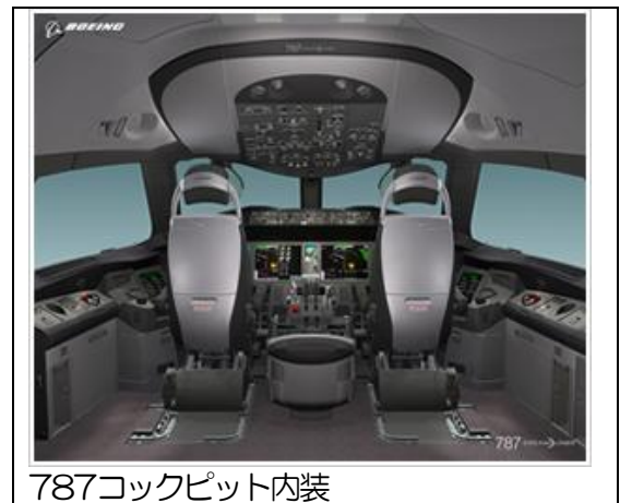
787コックピット内装